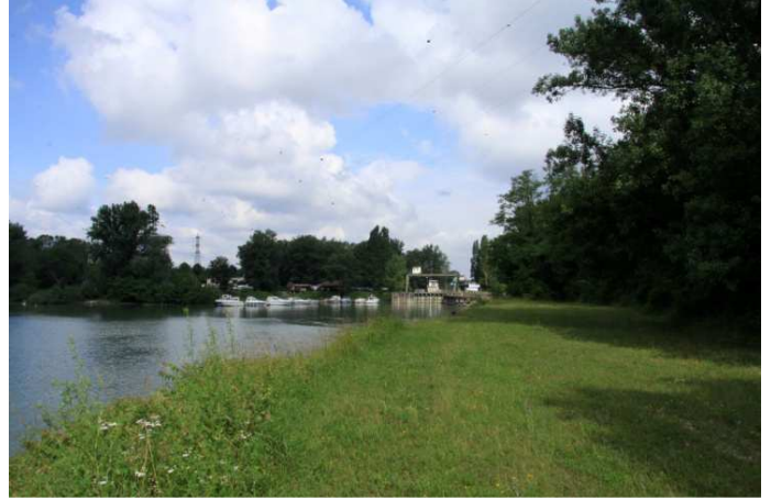
L'écluse Sud du Port du Rhin