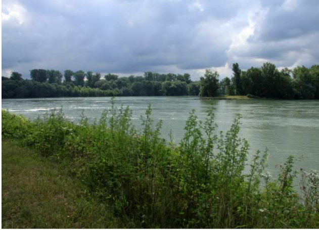
La pointe Sud de l'Île aux Epis

Potentilla reptans L. Senecio jacobaea L. Silene vulgaris (Moench) Garcke Thymus serpyllum L. sensu lato Viburnum lantana L.