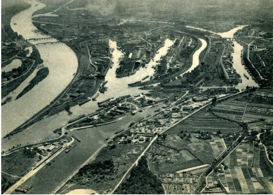
L'Île aux Epis lors de la construction du Port du Rhin