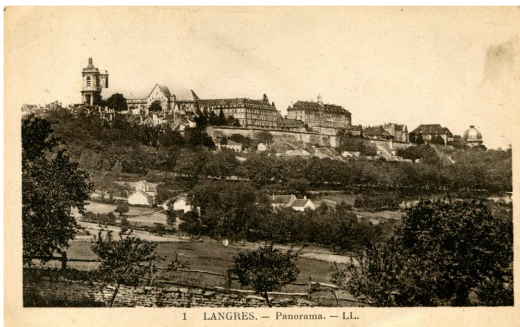
Langres vers 1930