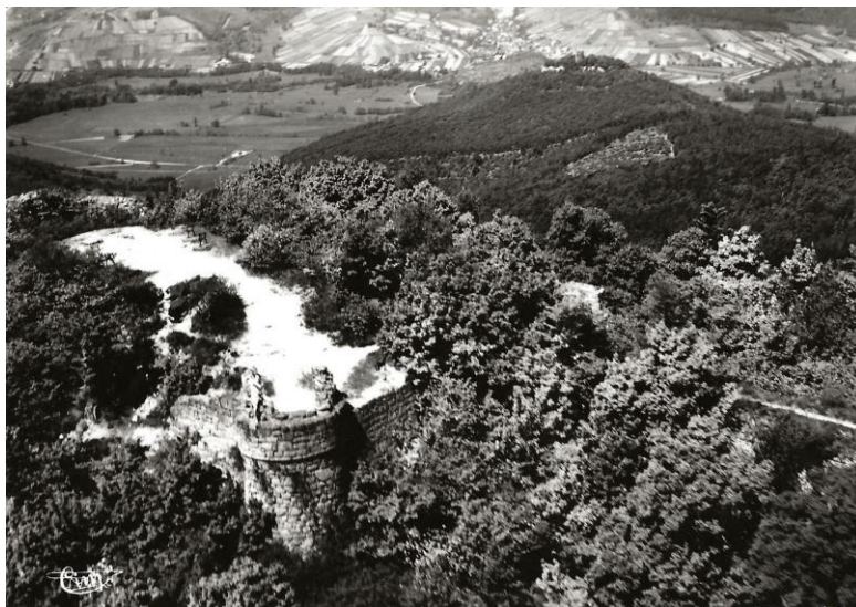
Le Château du Hohlandsbourg vers 1960

Dactylorhiza sambucina (L.) Soo - Statut : PA - EN Dictamnus albus L. - Statut : PA - VU Entodon schleicheri (Schimp.) Demet. - Statut : VU Fourraea alpina (L.) Greuter & Burdet - Statut : PA - VU Hieracium peleterianum Mérat - Statut : VU Jasione laevis Lam. - Statut : VU Lactuca perennis L. - Statut : CR Phleum phleoides (L.) Karsten - Statut : VU Potentilla inclinata Vill. - Statut : VU Potentilla rupestris L. - Statut : EN Silene viscaria (L.) Borkh. - Statut : EN Tephrosieris helenitis (L.) B. Nordenstam subsp. helenitis - Statut : PA - EN Thesium linophyllum L. - Statut : EN Trifolium rubens L. - Statut : VU