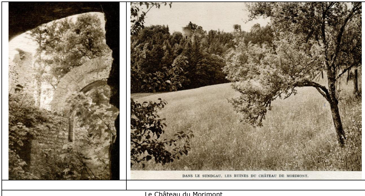
Le Château du Morimont

Gymnocarpium robertianum (Hoffm.) Newman - Statut : EN Holandrea carvifolia (Villars) Reduron, Charpin, Pimenov - Statut : VU Ranunculus biformis Walo Koch - Statut : Vicia dumetorum L. - Statut : PA - VU