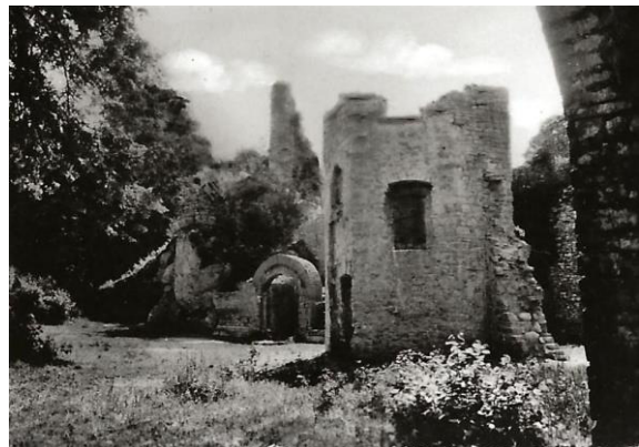
Le Château du Morimont vers 1960