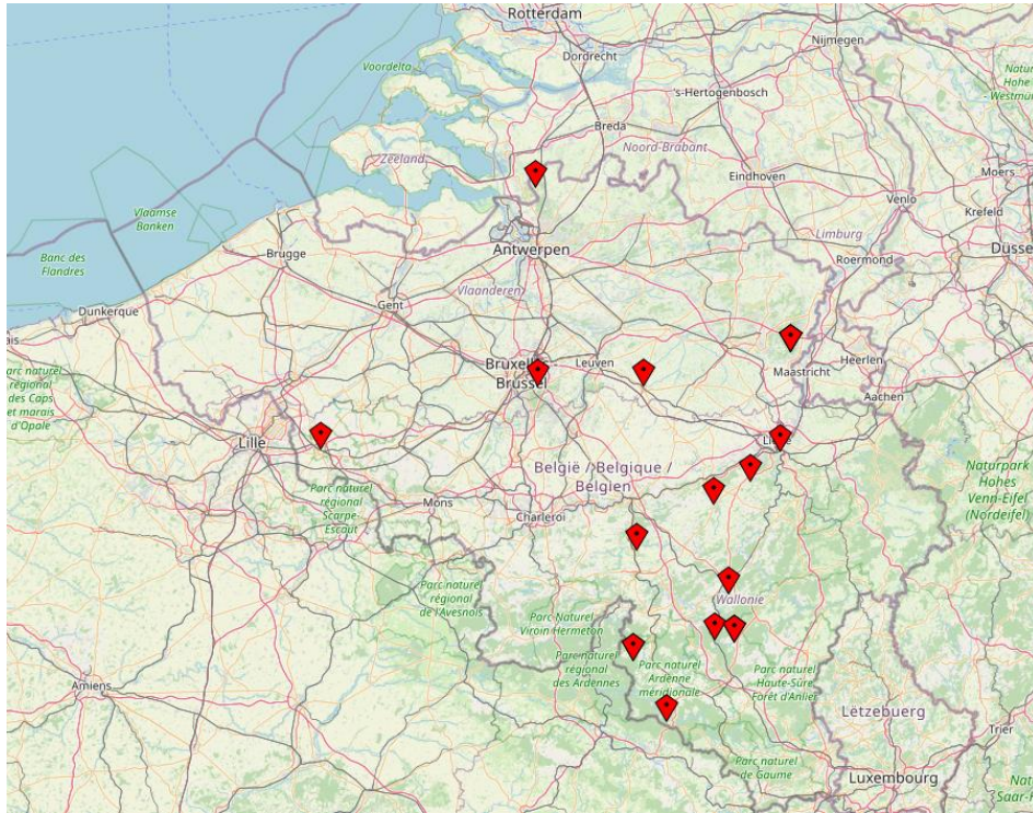
Carte des lieux de récoltes