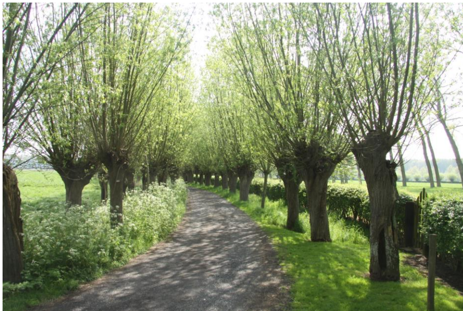
Une haie de saule têtard dans la campagne de la Flandre Occidentale.