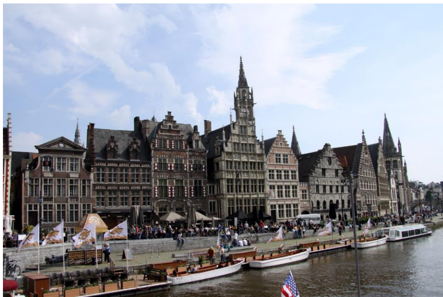
Gand. Le quai aux Herbes.

Salvia pratensis L. - THIELENS A. - [Belgique, Wallonie, Liège, Oneux] - Oneux, Prov. De Liège - X = 831961 - Y = 2613582 - Coteaux secs. - 7/1869 - Herbar(s) : STR - Société Vogéso-Rhénane - (sous : Salvia pratensis ).