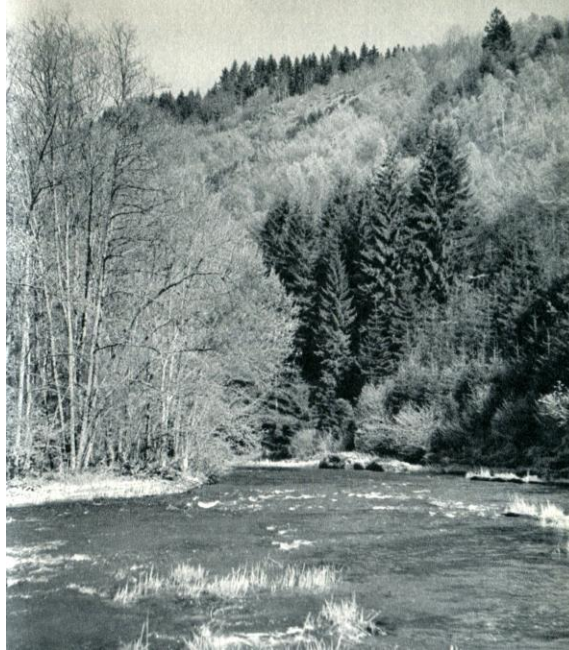
Belgique, Vallée de l'Ourthe (Wallonie)

Mentha spicata L. - DUVIGNEAUD J. - [Belgique, Wallonie, Liège, Angleur] - Angleur, île Rousseau, bord de l'Ourthe - X = 831417 - Y = 2628992 - 1974 - Herbar(s) : STR - Société pour l'Echange des Plantes vasculaires de l'Europe occidentale et du Bassin méditerranéen, Edit P. Auquier. [sans numéro de fascicule] - [Auquier, P.]. - (sous : Mentha spicata ) - STR-53869.