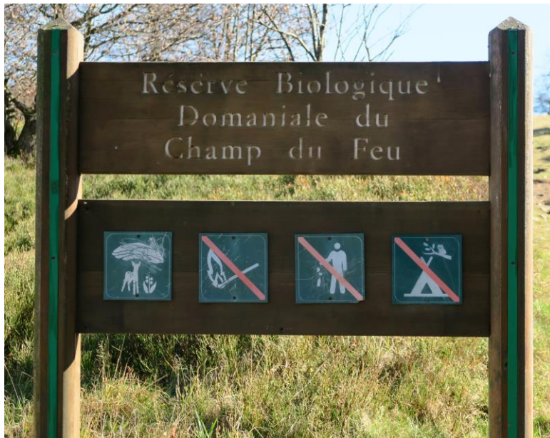
Réserve Biologique Domaniale du Champ du Feu