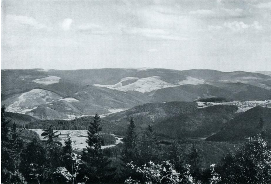
Le massif du Champ du Feu vue depuis le Donon