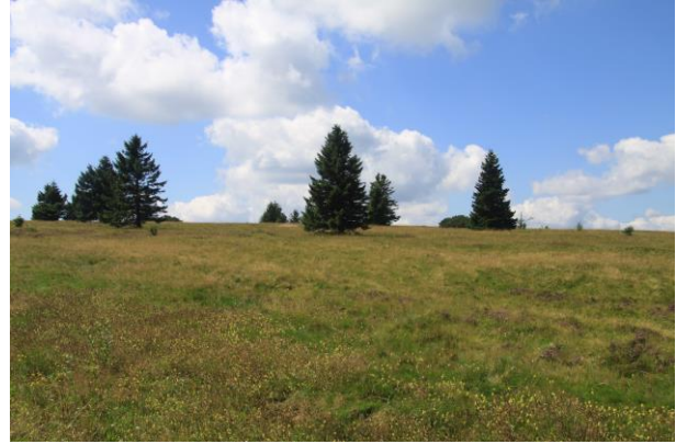
La lande du Champ du Feu. Été 2008.