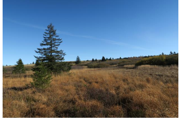
La tourbière du Champ du Feu. Automne 2015