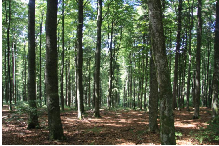
Hêtraie du Champ du Feu. Août 2010

Euphrasia stricta D. Wolff ex J.F. Lehm. - SCROPHULARIACEAE - Liste Rouge Alsace : LC. Fagus sylvatica L. - FAGACEAE - Liste Rouge Alsace : LC.