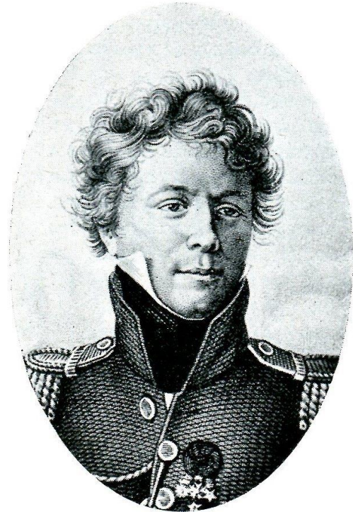
J.-B. BORY DE SAINT-VINCENT 1780-1846