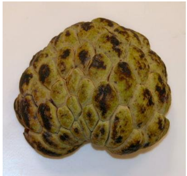
Annona squamosa – pomme cannelle