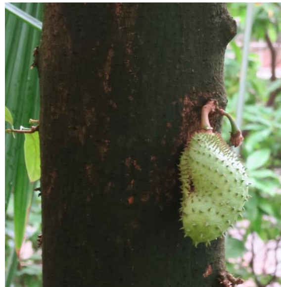
Annona muricata – corossol - Jardin botanique de Strasbourg