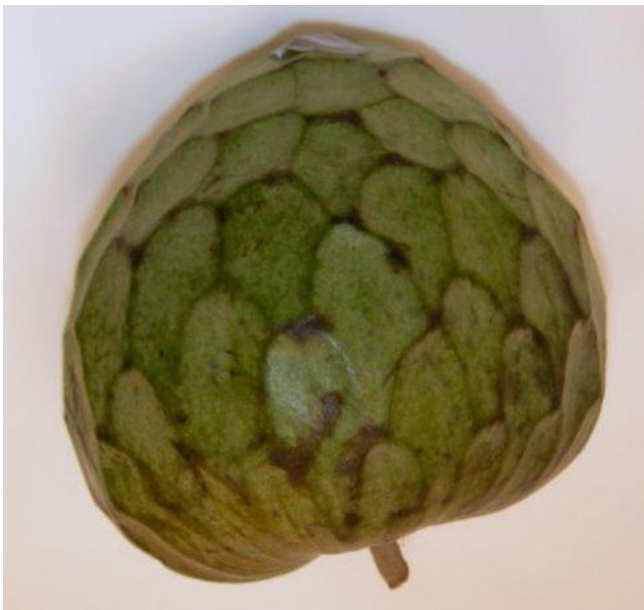
Annona cherimola – cherimole - STR- 91783