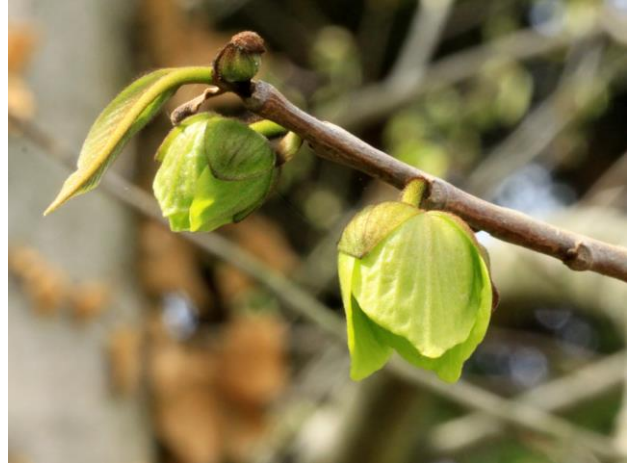
Asimina triloba - Jardin Botanique de Strasbourg.