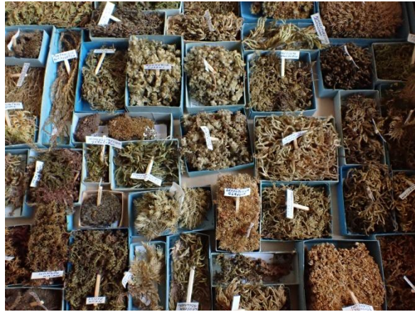
Les boîtes du moussier de Charles Lentz

Chaque échantillon est annoté du nom de son d'espèce sur une petite étiquette collée sur une allumette fixée dans l'échantillon.