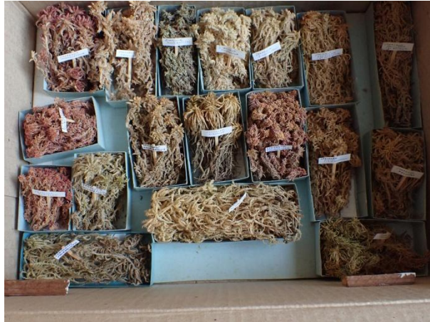
Les échantillons de Sphaignes

En annexe de cette petite note de présentation est joint un inventaire exhaustif des échantillons collectés par Charles Lentz.