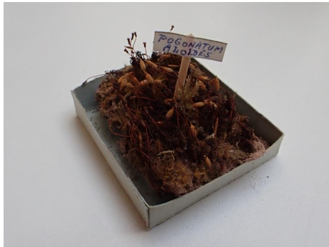
Étiquette des échantillons

Chaque échantillon est annoté du nom de son d'espèce sur une petite étiquette collée sur une allumette fixée dans l'échantillon.