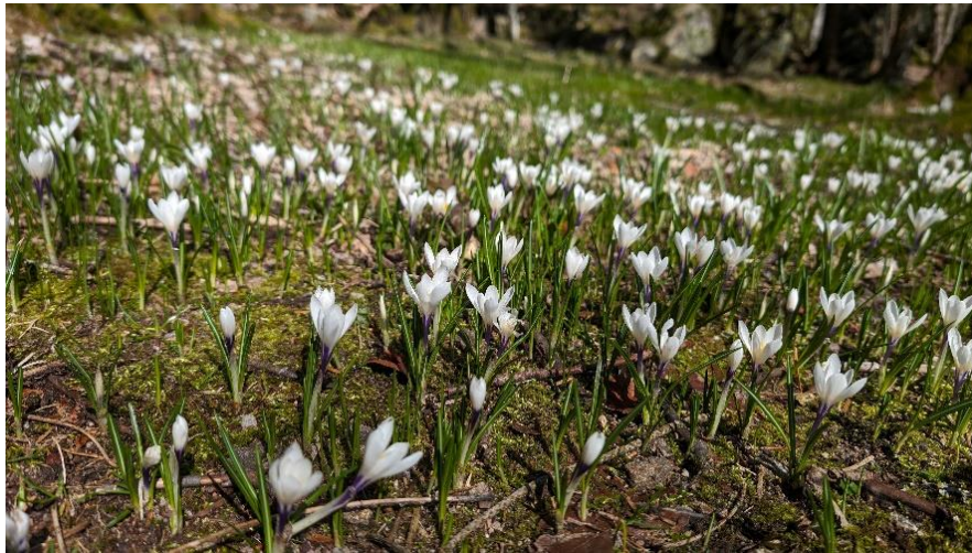
Crocus vernus subsp. albiflorus au Schiessrothried.

Crocus kotschyanus K.Koch, 1853 - (1). Crocus laevigatus Bory et Schaub, 1832 - (1). Crocus minimus DC., 1804 - (1). Crocus neapolitanus (Ker Gawl.) Loisel., 1817 - (11). Crocus nudiflorus Sm., 1798 - (5). Crocus ochroleucus Boiss. et Gaill., 1859 - (1). Crocus pallasii Goldb., 1817 - (1). Crocus reticulatus Steven ex Adam - (5). Crocus sativus L., 1753 - (18). Crocus serotinus Salisb. subsp. clusii (J. Gay) B. Mathew - (2). Crocus tommasinianus Herb., 1847 - (2). Crocus vernus (L.) Hill, 1765 - (15). Crocus versicolor Ker Gawl., 1808 - (5).