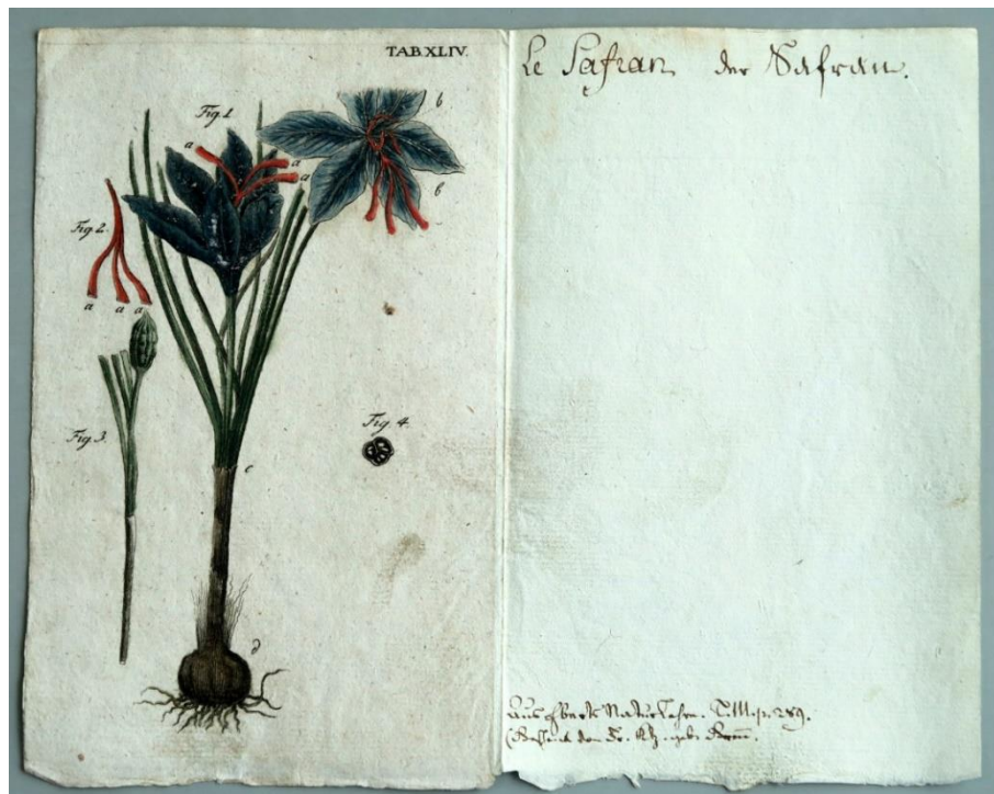
Crocus sativus . Le safran. Empreinte de J.F. Oberlin. Archives municipales de Strasbourg. Côte 77z3V.