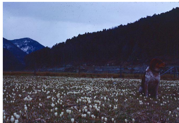
Crocus vernus à Wildenstein (Haut-Rhin) vers 1962.