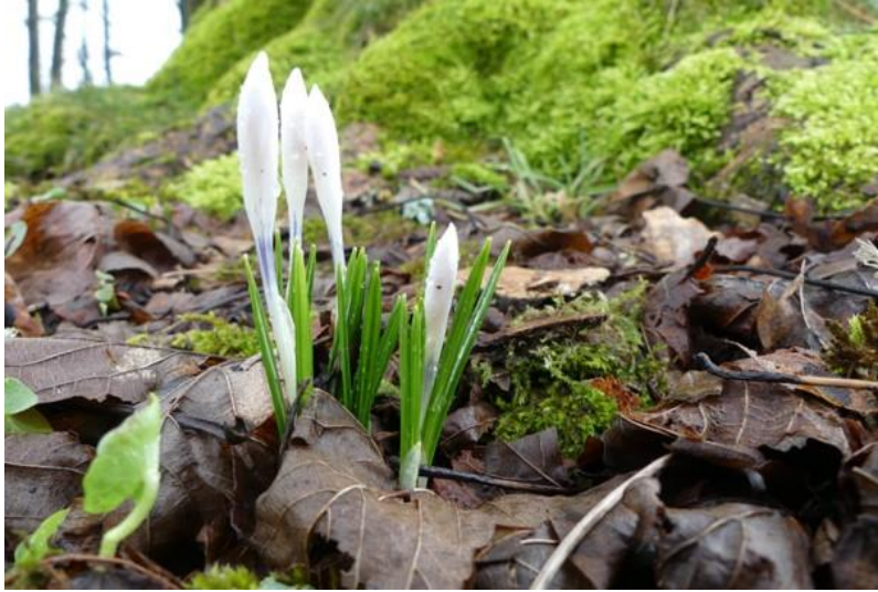
Crocus vernus subsp. albiflorus . Lucelle (Haut-Rhin). 14 mars 2020.

Crocus vernus (L.) Hill, 1765 - ENGEL R. - [France, Alsace, Haut-Rhin, Winkel - X = 971151 - Y = 2285067] - 3/ 4/1967 - Herbar(s) : STR - (sous : Crocus vernus (L.) Hill subsp. albiflorus (Kit.) Cesati) - STR- 11392.